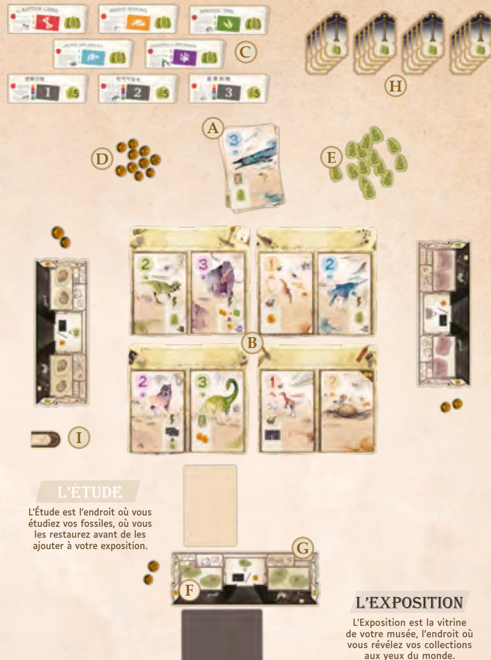
Exemple de mise en place à 3 personnes